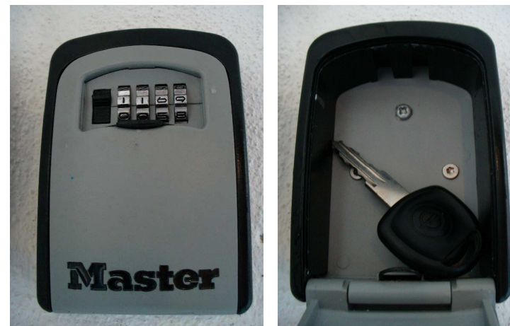
Tresor mit hinterlegtem Autoschlüssel