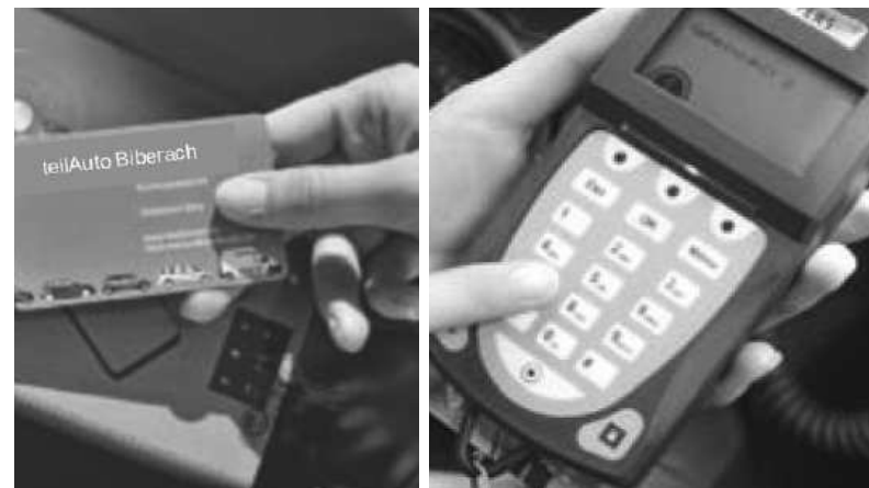
Zugangskarte und Abfrage der PIN